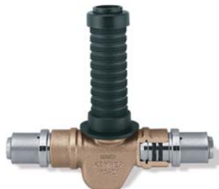
KEMPER 'UP-plus' met 'click'-aansluiting voor verschillende systemen figuur 560 08