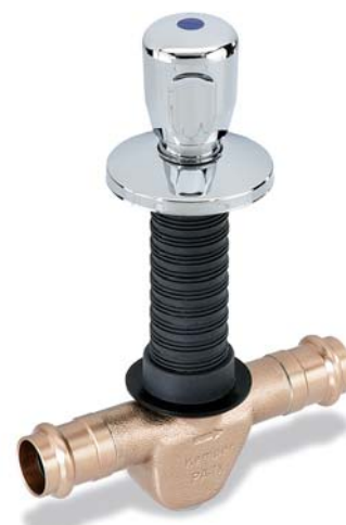
KEMPER 'UP-plus' met vaste persaansluitingen Viega figuur 524