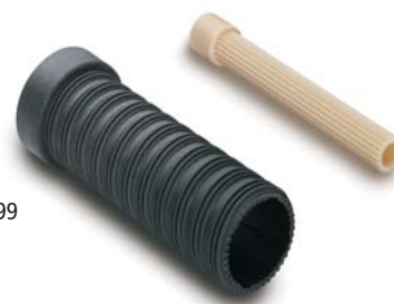
Verlengset voor 'UP-plus' figuur 599

KEMPER 'UP-plus' laat zich aan alle wensen aanpassen: Naar gelang van de gewenste inbouwdiepte in metselwerk, voorzetwand of schacht kan het bovenstuk van het ventiel verlengd worden.