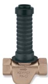
KEMPER 'UP-plus' met binnendraad figuur 560 01

Wie naar een aansluiting zoekt vindt van UP van KEMPER de passende oplossing. Want met het grote 'UP-plus'-programma is er voor elk installatiesysteem een passende oplossing. Dat spaart duur pleisterwerk. KEMPER heeft voor koperen, roestvaststalen, kunststof leidingen altijd de juiste aansluiting.