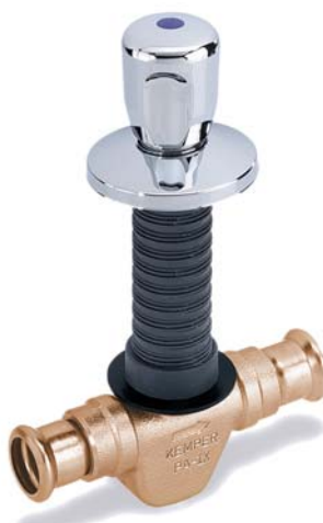
KEMPER 'UP-plus' met vaste persaansluitingen Mapress figuur 560 22

Deze veelzijdigheid biedt niet alleen een compleet pakket met belangrijke voordelen, maar betaalt zich telkens terug door besparing op de montagekosten: flexibiliteit voor elke wand en elke trend. Met op de toekomst gerichte techniek.