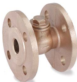
KEMPER keerkleppen met recht zitting met flensaansluiting figuur 165

KEMPER 'Full-Matic 4' vulstations voor verwarmingsinstallaties combinatie BA Figuur 365, stoomafsluiters in verschillende versies, filters en kranen ronden het aanbod af in diverse toepassingsgebieden.