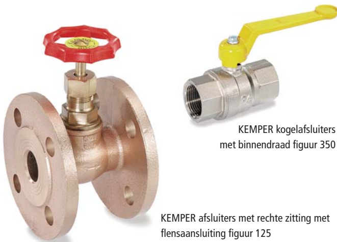
KEMPER kogelafsluiters met binnendraad figuur 350