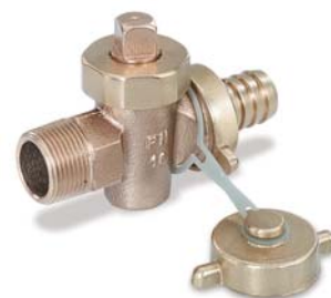
KEMPER tankvul- en aftappers figuur 307