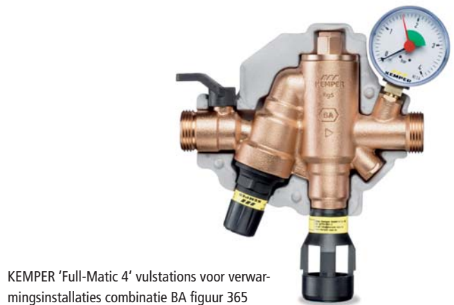
KEMPER 'Full-Matic 4' vulstations voor verwarmingsinstallaties combinatie BA figuur 365

Met veiligheidsafsluiters zoals antivervuilingsregelklep, leidingafsluiters en terugstroombeveiliging beschermt u het drinkwater tegen proceswater, met name bij industriële bedrijven. Wij beschermen de drinkwaterhygiëne van DN 15 t/m DN 150.