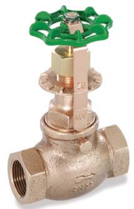
KEMPER fijne regelafsluiters met een rechte zitting voor stoominstallaties met binnendraad figuur 184